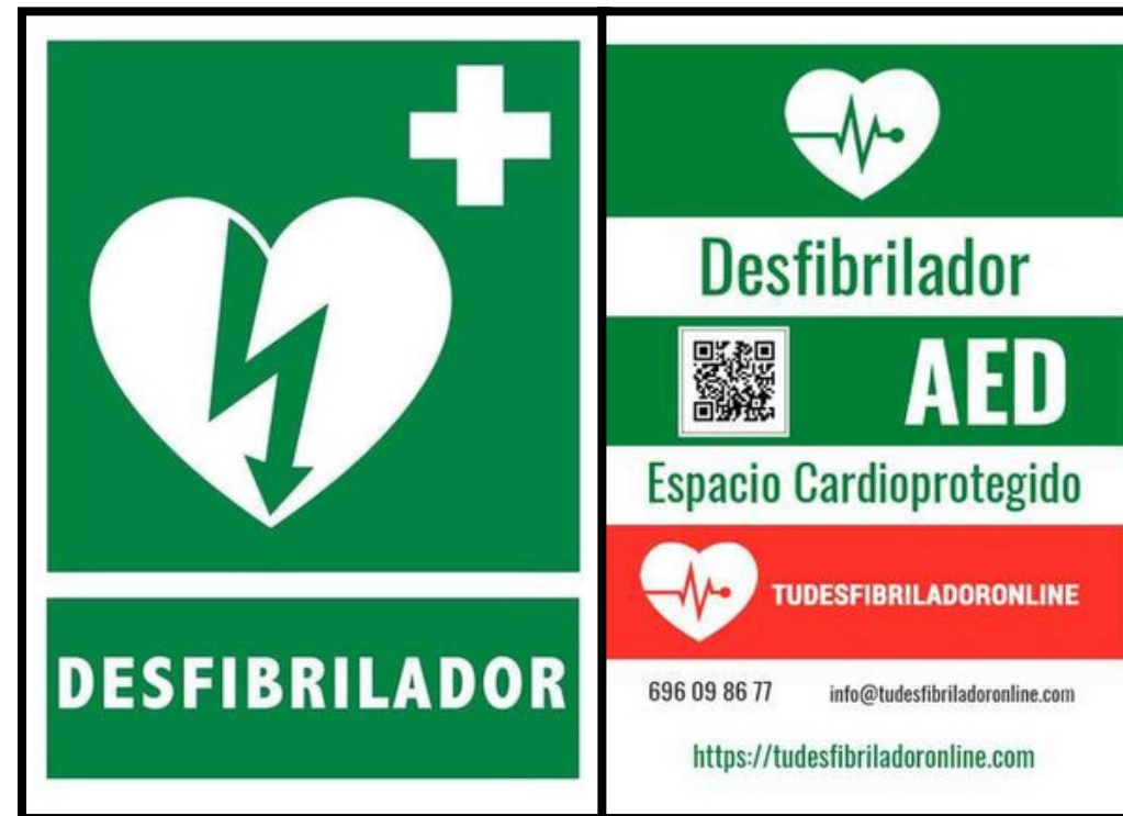
Señal espacio cardio protegido.