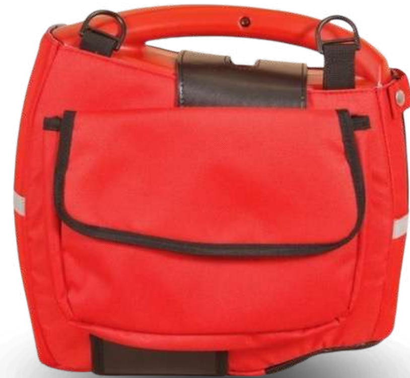
Bolsa de Transporte RescueSAM